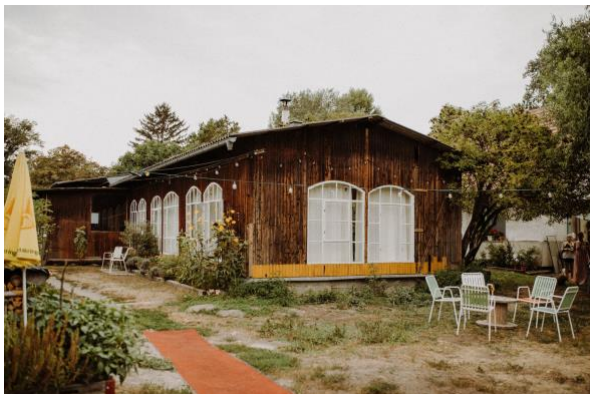
Salettl garden area