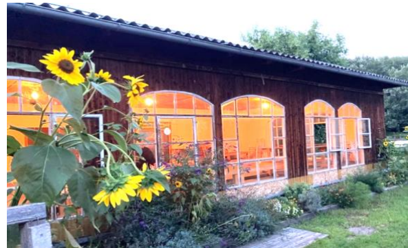
Salettl from outside