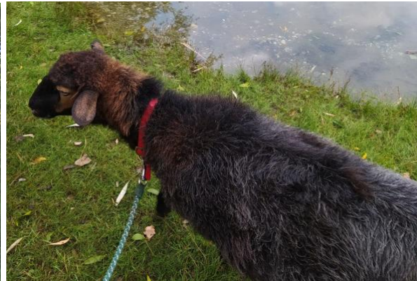
Lore, a resident on the community farmstead