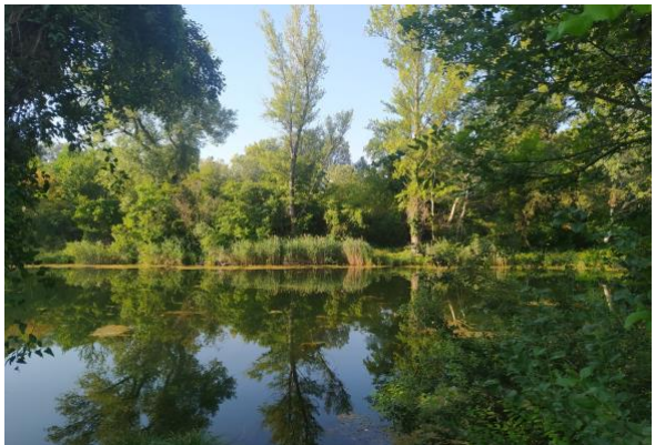
National park Lobau